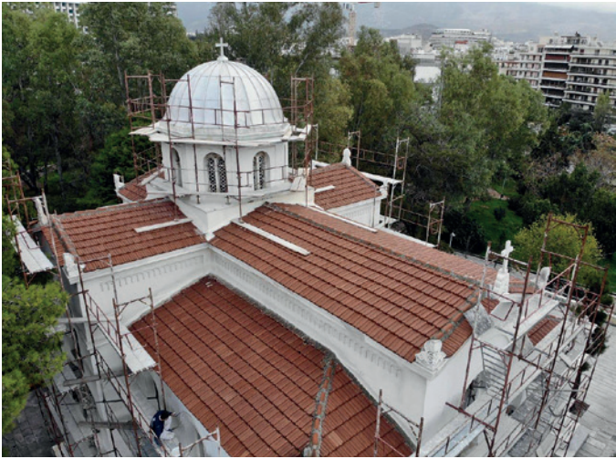
Πριν την ανακαίνιση